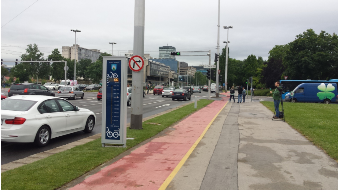
Ulica Grada Vukovara u Zagrebu

Motivirati ljude da se prebace sa automobila na bicikle traži poticaje i bez obzira na očite racionalne razloge kao što je svijest o očuvanju okoliša, financijske uštede i dr. Brojači bicikala odličan su način za promicanje biciklizma te podizanje svijesti o biciklizmu kao načinu prijevoza u gradovima te smanjenju prometnih gužvi u istima. Svojom prisutnošću potiču građane da razmisle o biciklu kao svakodnevnom prijevoznom sredstvu.